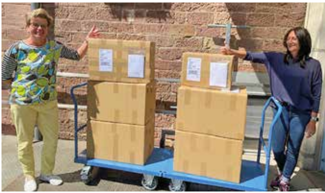
Geschafft – 6 Pakete für Bolivien sind versandfertig