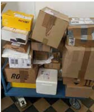
Wareneingangswagen – morgens