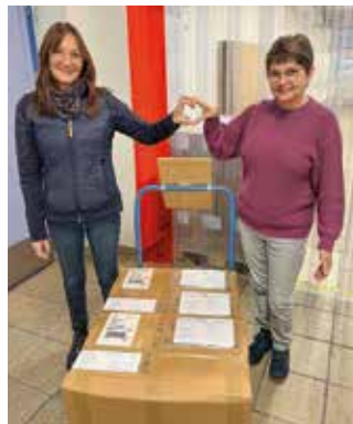
Geschafft – 2 Pakete versandfertig