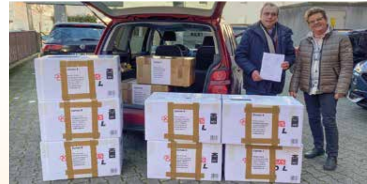
9 Pakete für die Ukraine werden abgeholt