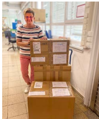
Geschäft – 3 Pakete versandfertig