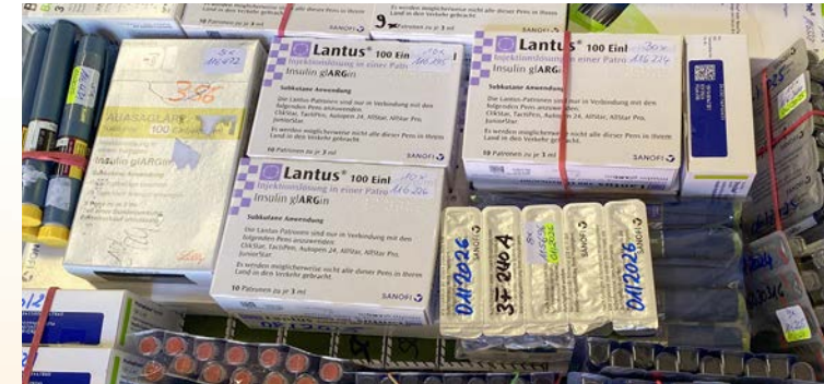
Für den Versand vorbereitetes Insulin