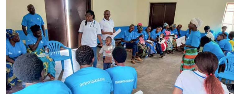
Lasst uns einander unterstützen!