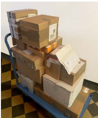
Wareneingangswagen – morgens