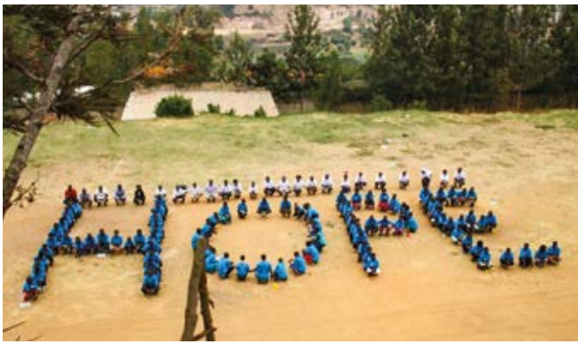
Camp 2017 - Die Teilnehmer bilden das Wort HOPE